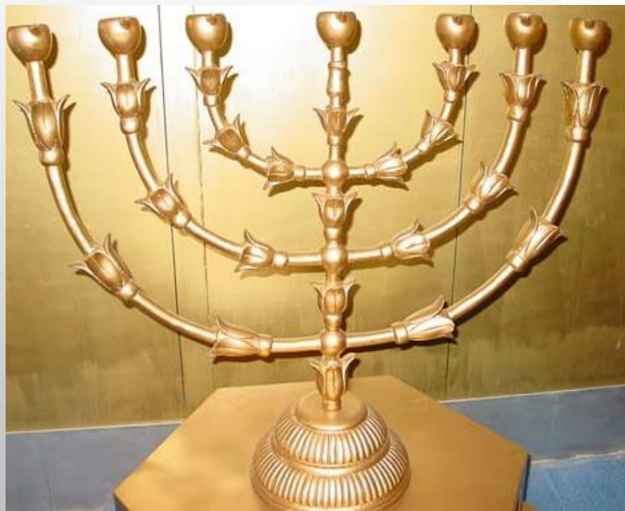
出埃及記的金燈臺